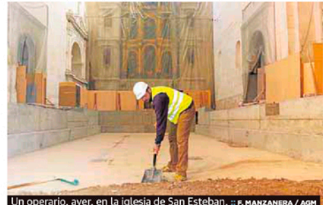
Un operario, ayer, en la iglesia de San Esteban.

:: LV. Desde mañana y hasta el próximo domingo se desarrollará en el Conservatorio Superior de Música de Murcia el XVIII Concurso para Estudiantes de Arpa que organiza Arpa Plus. La cita, que se celebra por primera vez en Murcia, se completa con una exposición de partituras y arpas, que se podrá visitar en el Conservatorio durante el fin de semana, de 17 a 20 horas el viernes, de 9.30 a 19 horas el sábado, y de 9.30 a 11 horas el domingo. Asimismo, el sábado, a las 20.30 horas, se llevará a cabo en el Auditorio Víctor Villegas de Murcia un concierto a cargo del arpista y compositor ruso Sasha Boldachev.